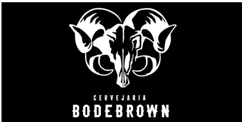
FIGURA 2 – Logo Bodebrown