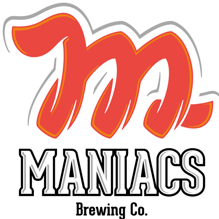
FIGURA 3 – Logo Maniacs Brewing Co.