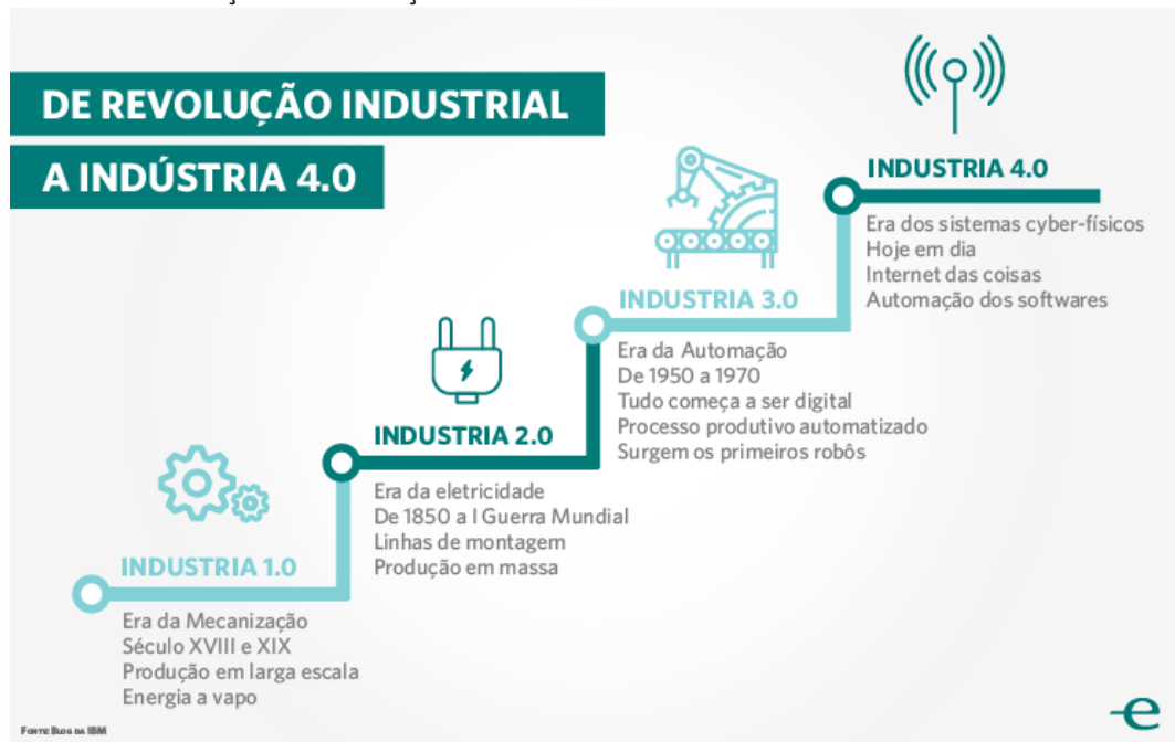
FIGURA 1 – Evolução das revoluções industriais

Para uma melhor compreensão, pode-se observar na FIG. 1, um progresso das revoluções industriais até que se alcance o nível de complexidade da indústria 4.0.